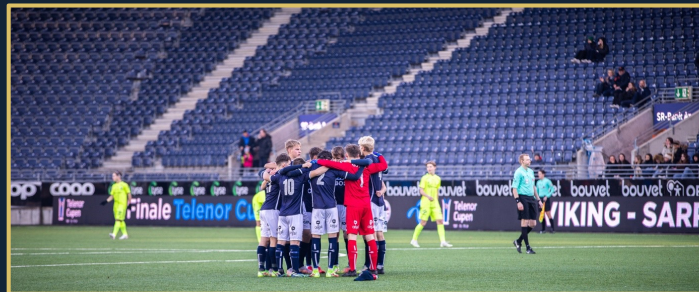
Kraft & Kjærlighet

Lagleder og trener har sammen et ansvar for at årsrapporten leveres ved årets slutt. Mal for årsrapport sendes ut av administrativ leder i Viking FK.